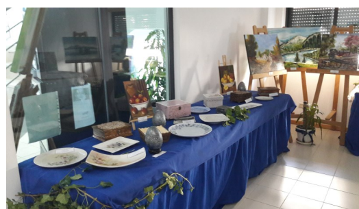
Exposição de trabalhos