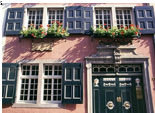
Beethovens Haus, in Bonn (A casa de Beethoven, em Bona)

Trabalho adaptado e traduzido pelos alunos da turma de Alemão da USE