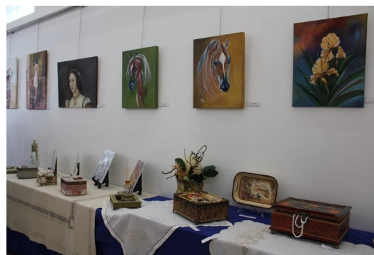
Exposição de trabalhos